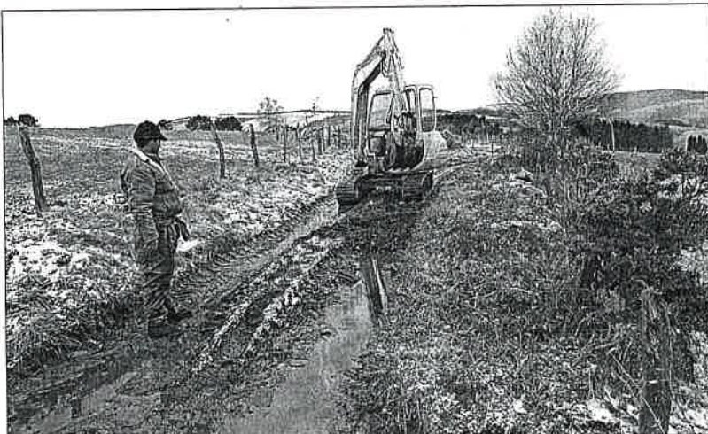
Trabajos forestales en un tramo del Camino de Santiago, en el concejo de Pola de Allande.

A su modo de ver, tanto el Camino de Santiago como los espacios protegidos o la zona costera son un patrimonio de interés social y general. «El coste de conservar y mantener lo que sea preciso proteger debe recaer en el conjunto de la sociedad, no sólo y exclusivamente en los propietarios o sectores empresariales afectados», añadió. También adelantó que, ante los posibles problemas que puedan surgir, el con-