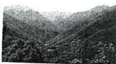
Bosque de Muniellos

• Las áreas prioritarias estarán sometidas a una estricta regulación que pretendía limitar al máximo las interferencias humanas. Los montes que tengan aprovechamientos deberían incorporar planes técnicos y proyectos de ordenación para limitar las molestias a las aves.