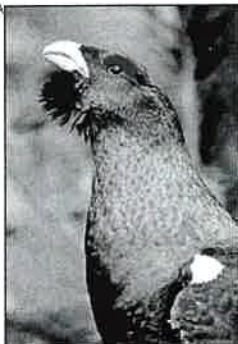
Un urogallo cantábrico.

El TSJA ha zanjado la entre las empresas madereras y el Principado a cuenta del urogallo. En concreto, a causa del Real Decreto 36/2003 de 14 de Mayo que rige el Plan de Conservación del Hábitat del Urogallo. Dicho plan limitaba la explotación forestal en determinadas zonas y causaba, según la asociación Asmadera, perjuicio a las empresas del sector. Además, para la elaboración de dicho plan, el Principado no contó con las opiniones de estos afectados. Fue por estas razones, entre otras, por lo que en su momento Asmadera presenta un recurso contencioso administrativo ante el Tribunal Superior de Justicia de Asturias. Y el pasado día 18 los tribunales les dan la razón y declaran nulo el Real Decreto. Al menos por ahora, porque desde el Principado ya han anunciado que el próximo martes presentarán un recurso contra esa sentencia.