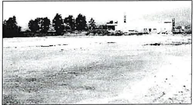
La parcela de La Curiscada en la que se construirá la fábrica de pellets.

La construcción de la primera fábrica de pellets de la región se iniciará antes del verano. La planta, que se ubicará en el polígono de La Curiscada (Tineo), empezará a funcionar en el último trimestre del año. Cinco empresas de la comarca y la Federación Asturiana de la Energía son los promotores de la iniciativa. La fábrica producirá entre 35.000 y 40.000 toneladas de pellets al año. La materia prima procederá de las cinco industrias madereras. Las instalaciones ocuparán una parcela de 13.000 metros cuadrados y la inversión se sitúa en torno a los 5 millones de euros.