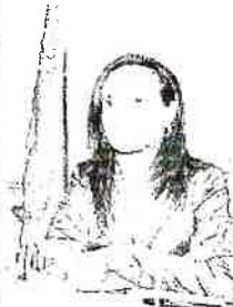
La ministra Beatriz Corredor.

Estas nuevas dependencias, que atenderán a 525 enfermos, fueron inauguradas ayer en un acto en el que el consejero de Salud, Ramón Quirós, indicó que en Asturias hay cerca de 4.000 personas afectadas por el Parkinson, una enfermedad crónica que ocasiona unos 120 fallecimientos al año.