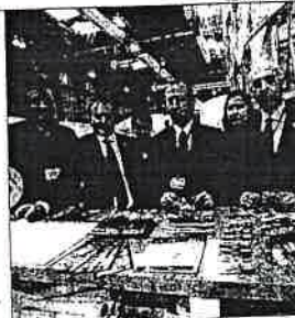
Los alcaldes de la Comarca

LOS ALCALDES de Siero, Llanera y Noreña presentan en la Feria Internacional de Turismo de Madrid (Fitur), la primera guía turística de la Comarca del Nora en la que se realiza un completo recorrido por Siero, Llanera y Noreña, mostrando los encantos de cada uno de los concejos. Se trata del primer acto oficial de los tres concejos bajo la nueva marca.