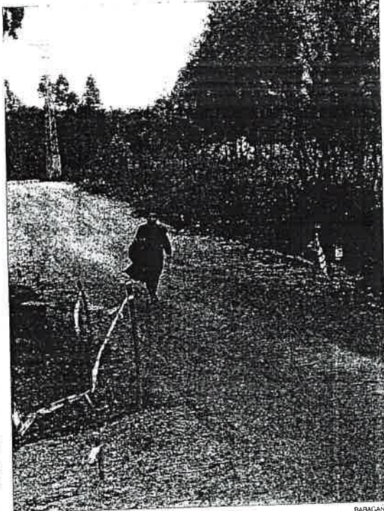
Un camino de Villaviciosa

El sector de la madera califica la medida municipal de «abuso económico»