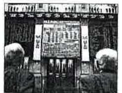
Bolsa de Madrid.

Las empresas constituidas en Asturias (113 nuevas sociedades mercantiles) se redujeron en el 32,7% en enero en relación al mismo período del año anterior, una compañía inferior a la media nacional, que se contrajo el 44,7%. Además Asturias fue la región que registró el mayor capital medio suscrito de las sociedades mercantiles constituidas en enero (263.558 euros), mientras Canarias presentó el menor (15.012 euros).