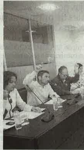
Los ediles de Foro Asturias

Las alegaciones presentadas fueron estudiadas en la última comisión informativa de medio rural y debatidas en el pleno ordinario celebrado en la tarde de ayer en el Ayuntamiento de Ribadesella. Las intenciones de los miembros de la corporación pasan por atender algunas de ellas.