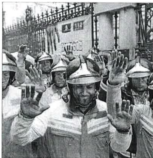
Movilización de los bomberos del Principado ante la Junta General.