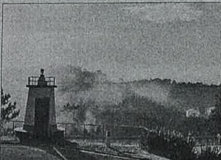
Humo en el entorno del pueblo.