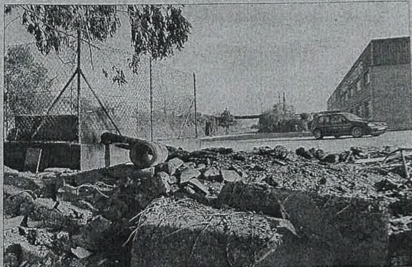
Restos de madera y otros materiales quemados en el entorno de la nave de Muebles Torre, en El Franco.

Ayer por la mañana, en un terreno cercano a estas naves empresariales un caballo desorientado huía de las brasas. No se sabe qué número de animales salvajes pudieron huir, desorientarse o