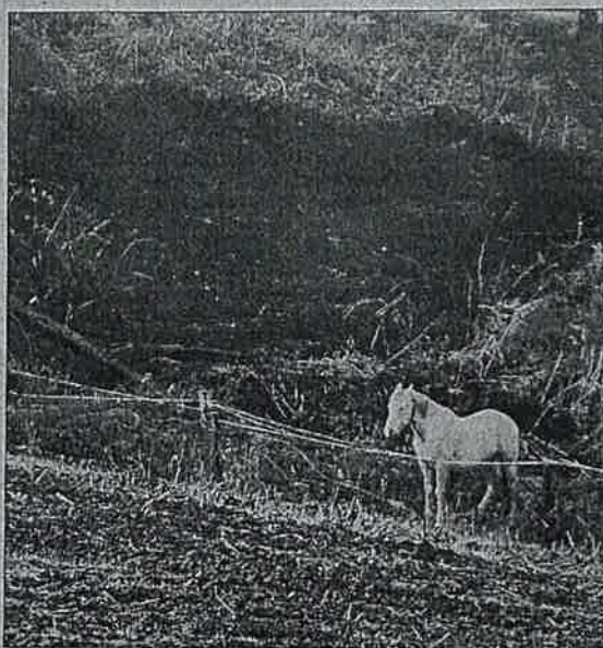
Un caballo en un monte quemado, cerca del polígono de Novales.

morir. Se recogieron perros y gatos, que en algunos casos acompañaron a sus vecinos desalojados o expectantes en la calle, pero los franquinos constataron la muerte de gallinas y cinco vacas. Las últimas, por inhalación de humo. De los salvajes, incluidos caballos con propietario que suelen pastar todo el día en el campo, no hay una estimación.