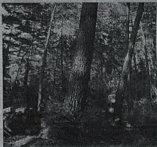
Madera cortada en un bosque.

Estos empresarios del sector forestal y de la madera iniciaron hace ya casi veinte años un intenso proceso de modernización de