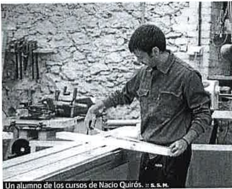
Un alumno de los cursos de Nacio Quiros. S.S.M.

► Perfiles. Estudia extender sus acciones formativas a perfiles profesionales como los arquitectos y aparejadores.