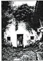
Capilla de La Fuexa Se ubica en la parroquia de Santa María de Villandás. Propiedad de la Iglesia.