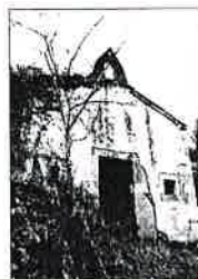
Capilla de Los Lodos En ruinas. Esta capilla es propiedad de la Iglesia.