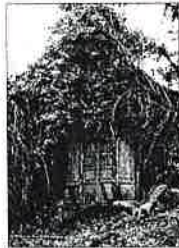
Capilla de Robledo Propiedad privada. Una de las capillas más deterioradas del concejo moscón.