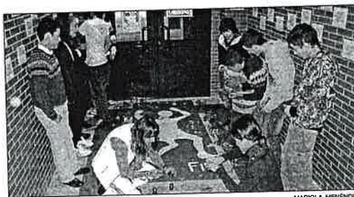
Alumnos y profesoras encienden velas por las víctimas de la violencia.

El fin de estos cursos formativos, que tendrán continuidad, es conseguir, a través del trabajo, la integración completa de las personas con discapacidad intelectual. Los participantes en esta actividad recibieron sus diplomas ayer en el Ayuntamiento entre los aplausos de sus compañeros.