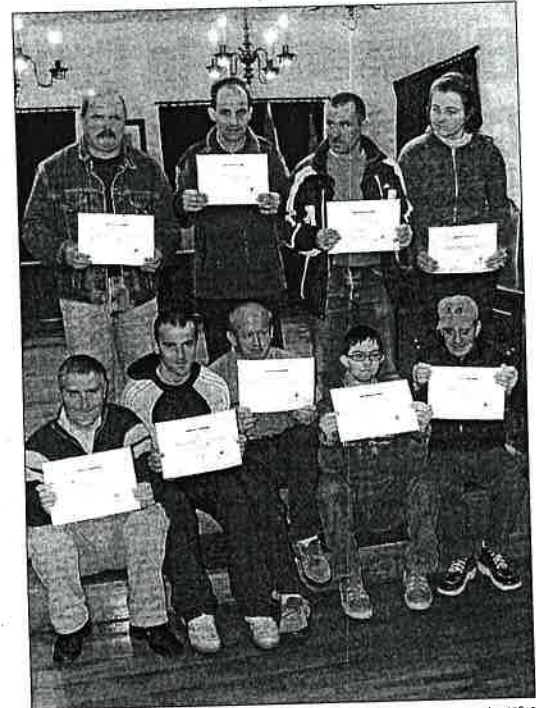
Los participantes en el curso formativo, tras recoger el diploma.