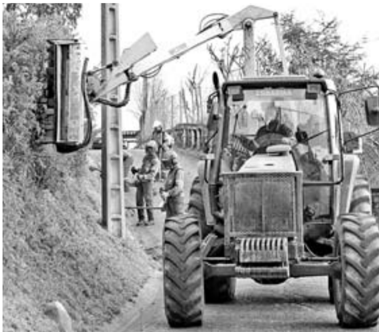
Operarios de una empresa forestal realizando labores de limpieza de cunetas. A la derecha, un tractor con desbrozadora de brazo limpiando el talud de un camino.